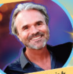
L. Fixaris - fixaris.fr